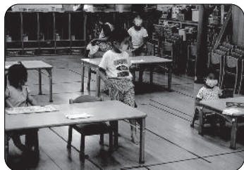
マスクを着用して、離れて座る