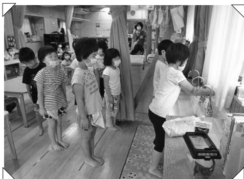
一人ひとり手洗い用のタオルを持って、間隔を守って並ぶ