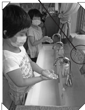
絵を見てしっかり洗う