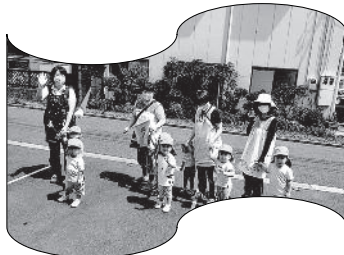
散歩にいつてきまーす