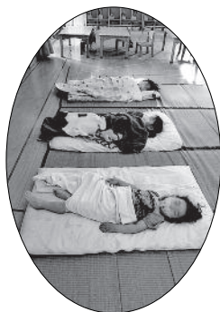
「フィジカル・ディスタンス」 を守って午睡